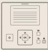
Kabelový ovladač PC-ARFH1E