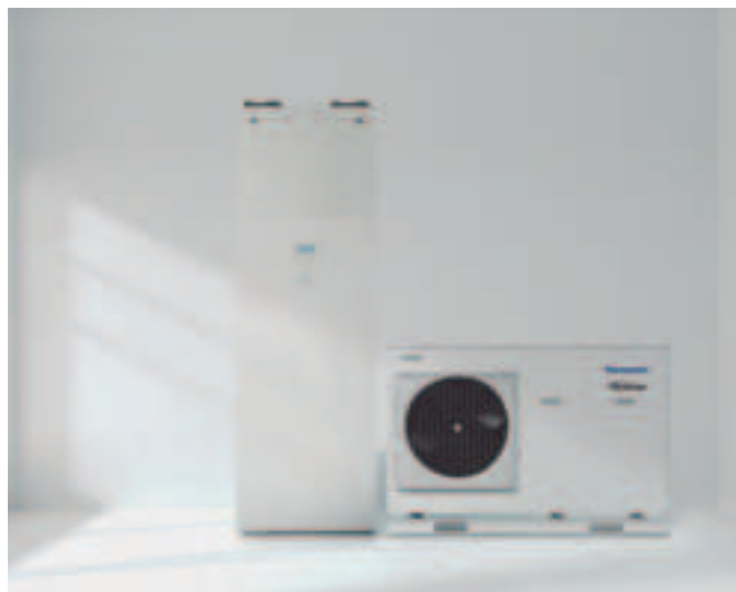
Jedná se o koncepční představu, může dojít ke změně bez předchozího oznámení.